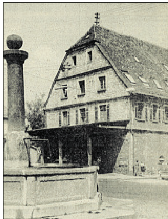
Erste „echte“ Trainingsstätte der Nürtinger Judokas war der Steinernen Bau. Zuvor hatten die Trainingseinheiten auf Rasen stattgefunden.