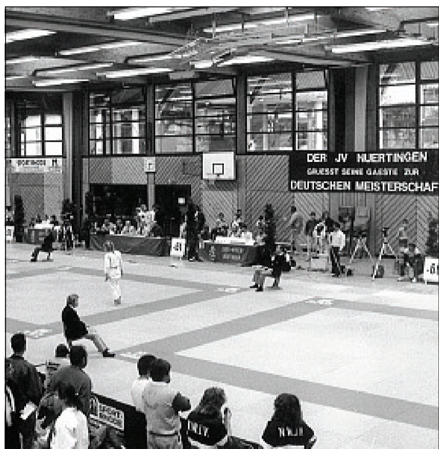
Der JVN genießt bundesweit einen hervorragenden Ruf als Ausrichter von Judoveranstaltungen. 1987 und 1989 fanden die Deutschen Meisterschaften der weiblichen Jugend A in der Eisenlohr-Halle statt. Am 23. und 24. Oktober 2010 richtet der JVN die Süddeutschen Meisterschaften der U14 aus.