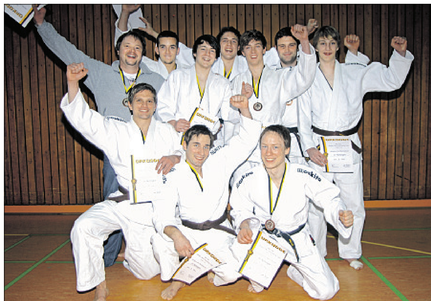
Die erste Mannschaft des JVN kämpft seit 1985 ununterbrochen in der höchsten württembergischen Klasse. Vor fünf Jahren gelang der Aufstieg in die Baden-Württemberg-Liga. Pünktlich zum Jubiläum feierte das Team, ausnahmslos mit Eigengewächsen bestückt, mit dem Gewinn der Bronzemedaille einen tollen Erfolg.