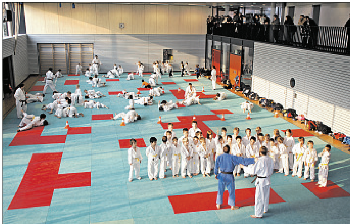
Von 1962 bis 1969 trainierte der JVN im Gymnastikraum des MPG, danach in der Sporthalle der Nürtinger Berufsschule. Seit 2004 hat der JVN in der Mörikehalle seine Heimat gefunden. Auf 351 Quadratmetern Mattenfläche trainieren in Stoßzeiten bis zu 100 Kinder und Jugendliche.